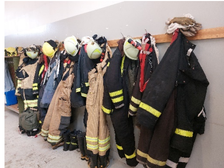
Mynd 2 Suðureyri