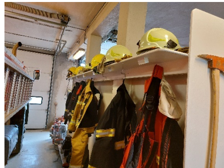
Mynd 4 Þingeyri