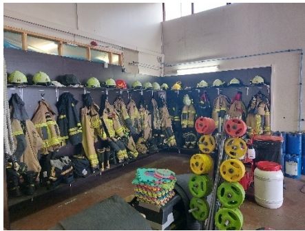
Mynd 1 Ísafjörður