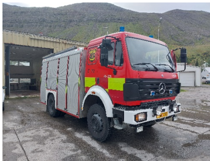
Mynd 9 Suðureyri