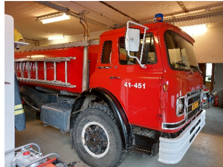
Mynd 10 Þingeyri