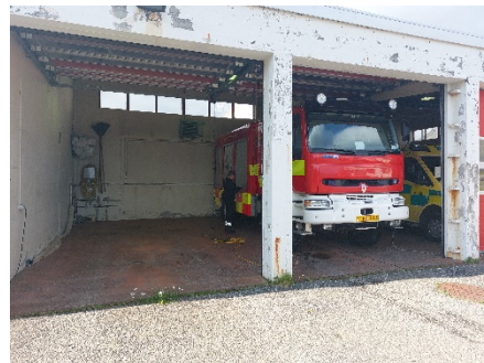
Mynd 6 Ísafjörður