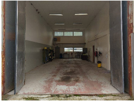
Mynd 7 Suðureyri