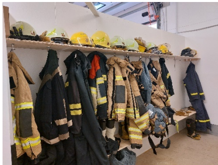
Mynd 3 Flateyri