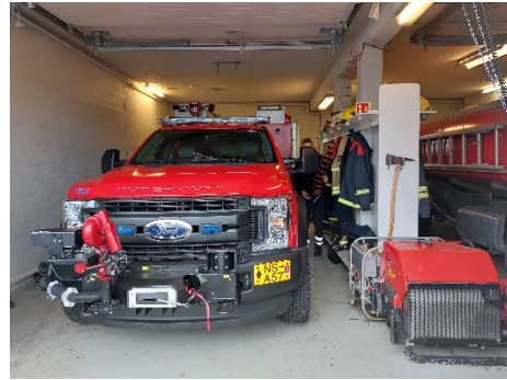
Mynd 8 Þingeyri