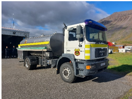
Mynd 11 Ísafjörður