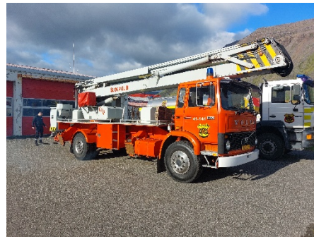
Mynd 12 Ísafjörður