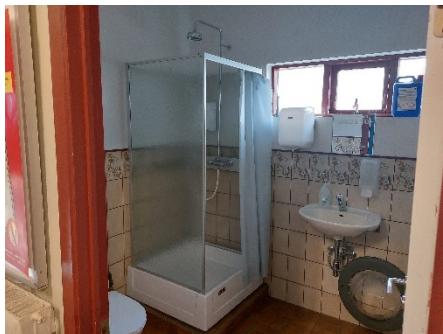
Mynd 5 Ísafjörður